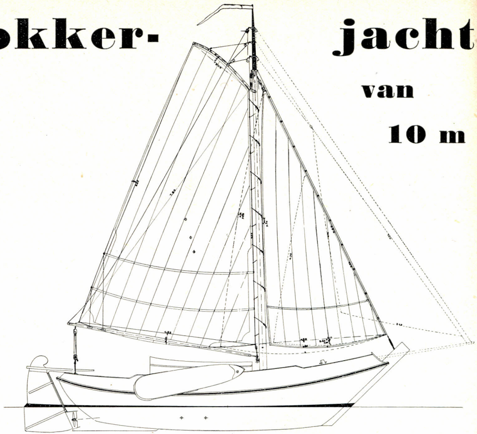
Schokkerjacht, ontwerp Ir. H. Vreedenburgh. Zeiltekening schaal 1:100. Zeiloppervlak 39 m 2 , grootzeil 26.50 m 2 , stagfok 12.50 m 2 , kluiver 8.50 m 2 , botterfok 17.50 m 2 , stormfok 7.30 m 2 .

Als fraai type was de hoogaars favoriet, maar de relatief geringe stahoogte bij een